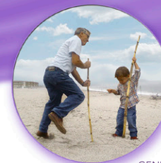
GENIETEN VAN PENSIOEN