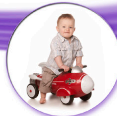
AANSCHAF NIEUWE AUTO