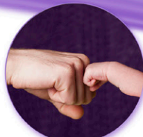
PAPA GAAT 1 DAG MINDER WERKEN